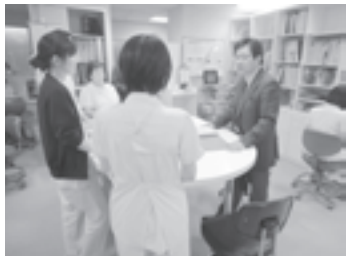
※医療福祉現場での意見交換は重要です。

医療、介護従事者をはじめ、地域で高齢者、障がい者の暮らしを支える仕組みの構築が求められています。特に、「在宅」に重きをおいた支援サービスへのシフトが必要です。